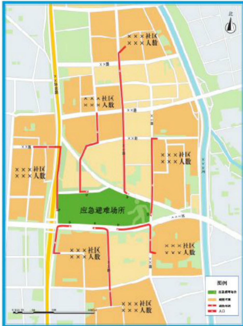
×××地震应急避难场所疏散路线图