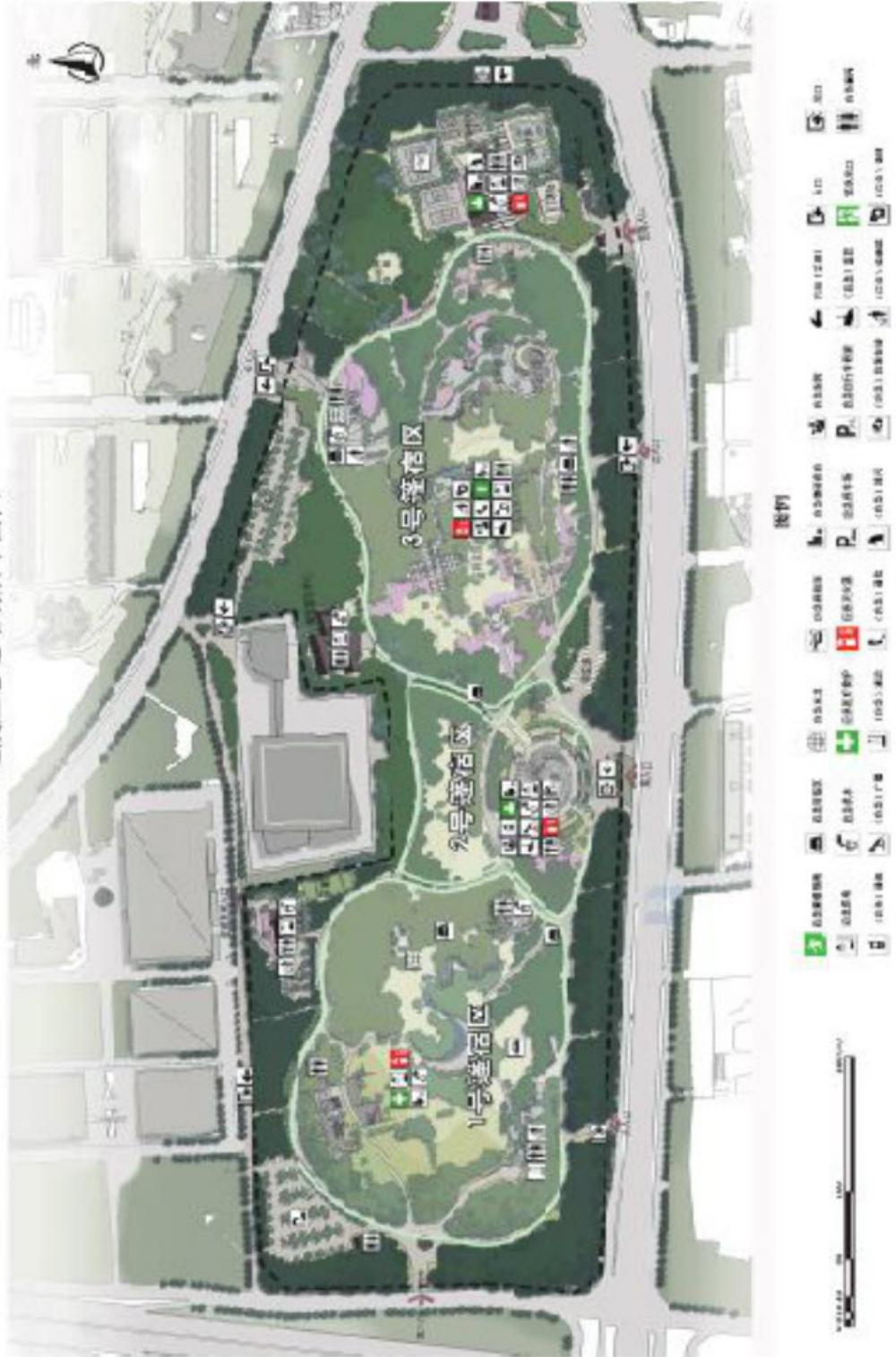
图 C.1 安置区域图示例