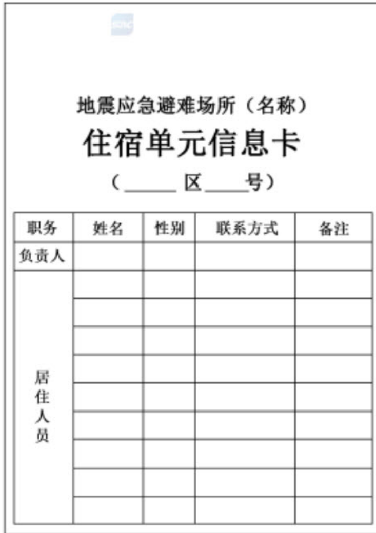
图 J.1 地震应急避难场所住宿单元信息卡

地震应急避难场所住宿设施管理单元信息卡模版样式见图 J.1, 其中“地震应急避难场所(名称)”为对应的应急避难场所的实际名称, 在制作时应用实际名称替换。